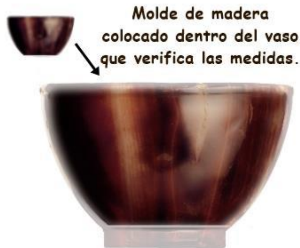
ILUSTRACIÓN 4: EJEMPLO VISUAL DEL POSIBLE PROCESO LLEVADO A CABO EN LA FABRICACIÓN DE LAS COPAS EN PIEDRA, PARA LA COMPROBACIÓN DE SUS MEDIDAS CONFORME A LA TRADICIÓN JUDÍA.

Los dos primeros dedos la copa superior del Santo Cáliz representan un reviít , que es la cantidad mínima de ingesta de vino considerada adecuada para celebrar el Pésaj (Pascua en hebreo).