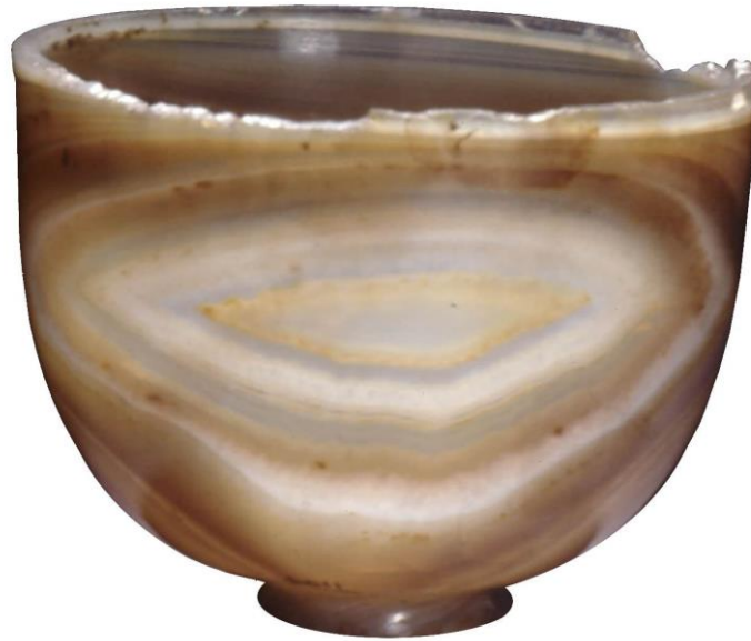
ILUSTRACIÓN 2: COPA DE ÁGATA. IMPERIO ROMANO. (S. I –II). BRITISH MUSEUM, LONDRES. TRATAMIENTO DIGITAL DE LA IMAGEN: CRISÁLIDA, VALENCIA. CORTESÍA DEL BRITISH MUSEUM.

En la tesis se muestra un ejemplo de copa de ágata de los siglos I – II d. C. expuesta en el Museo Británico. Por observación directa, se aprecia esta diferencia fundamental de elección de “tipo de corte” ente esta copa de ágata y el vaso superior del Santo Cáliz.